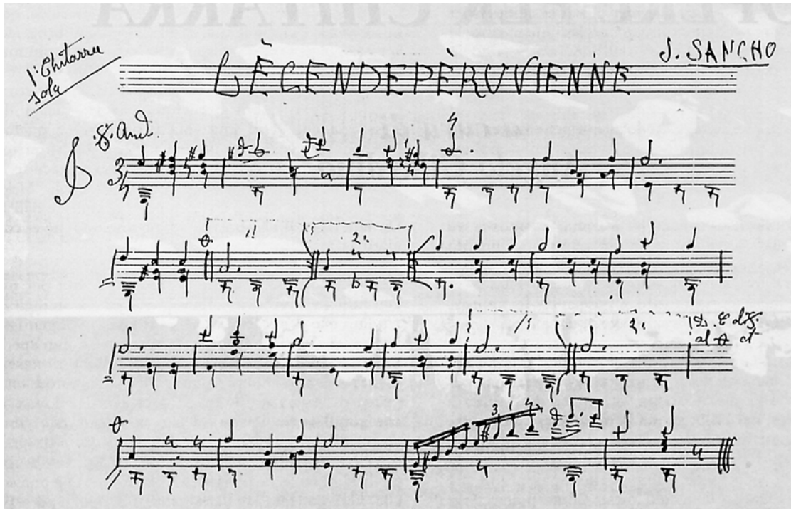
Archivo, Luigi Mozzani

Bibliografía: Luigi Mozzani "OPERE PER CHITARRA", a cargo de Angelo Gilardino (Ed. Bèrben,1995).